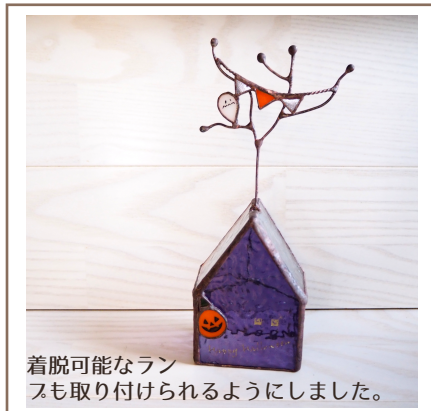
着脱可能なラン スも取り付けられるようにしました。