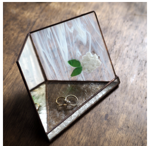
ツヤ感たっぷりの白のお花をフュージングで焼き込んだガラスと鏡を組み合わせて作ったアクセサリートレイです。リングピローにもピッタリです。

どの作品も、ガラス教室のレッスンでお作りいただけます。作ってみたいものがありましたら、お気軽におっしゃってくださいね。