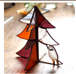
ハロウィンツリーを作りました。こちらのハロウィンツリー、キットも用意しています♪

スタンドグラスで作ったアンティークな宝箱です。蓋が開け閉めできるように作りました。