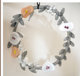
フュージングで作ったのお花のリースです。左のスタンドグラスのリースとパーツは似ていますが組み立てる方法が違うと、随分仕上がりの印象も違いますね。