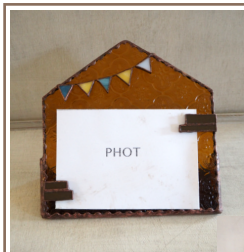
お家の形のフォトフレームです。お家のレンガに見立てたガラスで写真がとまるようにしました。