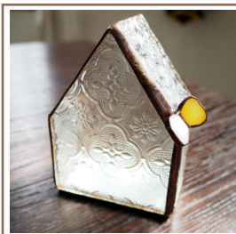
お家型の小物入れです。色々パーツごとに色をガラスで作ったので、シンプルな感じに仕上がりました。