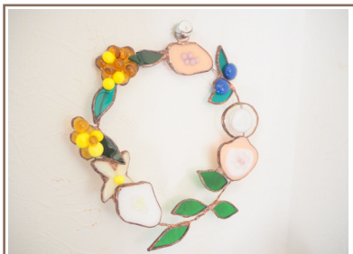
スタンドグラスで作ったお花のリースです。細めの真鍮を軸にして作りました。