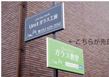
←こちらが先日設置した看板

2月20日に新しく、工房の裏側に看板を設置しました。更に、いい機会なので工房の正面に、手作り看板を3月に建てようとして計画しています。近くまで来ても、目立つ看板が無くて分かりにくいと言う声があり設置しました。ホームページにアクセスして頂ききっかけとして、ブログ、インスタグラム、フェイスブック、路上の看板、折込チラシ、フリーペーパー・・・等々していますが、工房の近くを通る人にもアピールと目印の看板作りです。宣伝広告って、先に結果が分からないので非常に難しいですね。色々出来る範囲で試しながらやっていますが、でも何だか楽しいですね!!