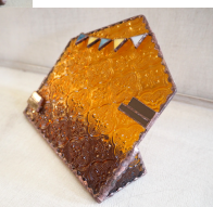
横から見るとこんな感じで自立しているので飾りやすいんです。